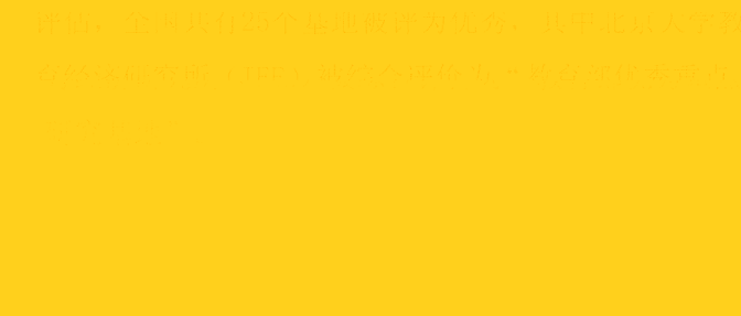
以色列海法大学Freema Elbaz教授来我院举办工作坊

9月11日，以色列海法大学Freema Elbaz教授来我院举办了为期四天的叙事研究工作坊。来自教育学院的数十名对叙事研究有兴趣的师生参与了这一学术活动。Elbaz教授分别作了《如何应用叙事方法研究（教